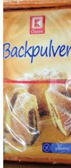
Backpulver im Tütchen [2]