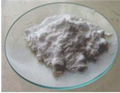
Natron auf einem Tellerchen [1]

Heilung von Krebs, Miome, Blutgerinnsel - und Organe, Drüsen, Nerven: Diabetes, Impfschäden (Allergien, Asthma, Schilddrüse); Nieren, Leber, Lungen (TB, Lungenentzündung, Bronchitis, Raucherlunge), Depression, Alkoholismus, Grippe in 3 Tagen - mit Natron+Apfelessig heilen speziell: Kreislauf, Durchblutung, Taubheit der Glieder, kalte Hände und Füße, hoher Blutdruck, Herzprobleme, Hirne, Muskelkrämpfe etc.