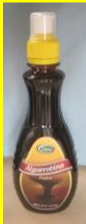
Algarrobina vom Algarroba- Baum in Süd-"Amerika" [6]