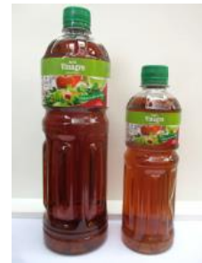
Apfelessig in Kombination mit Natron ergibt eine Art Limonade, die in 2 Tagen den pH-Wert auf pH7,3 steigert [5]

von Michael Palomino, Lima (August 2017)