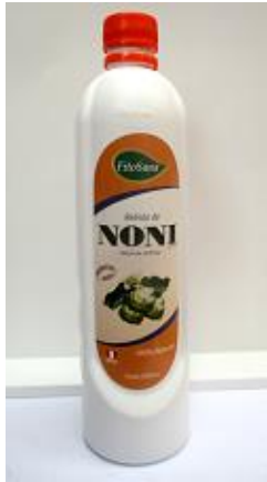
Noni heilt Krebs, Diabetes UND reduziert Übergewicht [11]

Noni ist eine Superfrucht mit über 100 Vitaminen, Mineralien und Enzymen, bewirkt aber auch Gewichtsabnahme. Leute, die also diese Krankheiten haben und gleichzeitig an Übergewicht leiden, die werden dann mit Noni auch ihr Gewicht normalisieren.