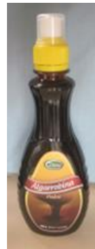
Zuckermelasse [5] oder Algarobina [6] bewirken eine natürliche Süsse mit dem Natron und verstärken die Heilwirkung mit Mineralien

Am Anfang der Heilung kann ein kurzer Durchfall auftreten. 10% der Krebspatienten und Diabetespatienten haben ausserdem weitere negative Reaktionen und müssen sich mit Blutgruppenernährung oder Fruchtextrakten (Noni, Yacon etc.) heilen. Die Heilung ist dann teurer und dauert 3 bis 6 Monaten. Die anderen 90%, die Natron gut vertragen, nehmen Natron während 10 Tagen ein. Bei anderen Krankheiten wie Allergien, Asthma oder Lungenkrankheiten vertragen Natron bisher (Stand Juli 2017) zu 100%.