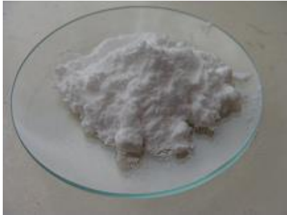
Natron auf einem Tellerchen [1]

Heilung von Krebs (90%) und Organe, Drüsen, Nerven: Diabetes (90%); 100%: Impfschäden (Allergien, Asthma, Schilddrüse); Nieren, Lungen (TB, Lungenentzündung, Bronchitis, Raucherlunge), Depression, Alkoholismus, Grippe in 3 Tagen - mit Natron+Apfelessig heilen auch: Kreislauf, Durchblutung, Taubheit der Glieder, kalte Hände und Füße, hoher Blutdruck, Herzprobleme, Muskelkrämpfe etc.