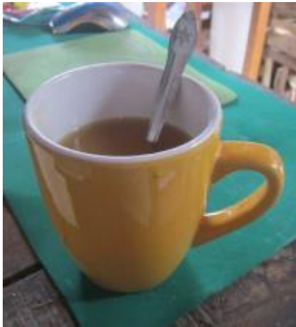
1 Tasse mit Natronlösung mit Zuckermelasse [3]

Das Natron ist ein Heilmittel mit einem starken Heileffekt: Man nimmt 1 Teelöffel Natron in 1 Glas Wasser nüchtern am Morgen und abends 2 Stunden nach der letzten Mahlzeit ein. Auf diese Weise steigt der pH-Wert. Man kann die Natronlösung mit Zuckermelasse oder Honig süßen, je nach Geschmack. Auf diese Weise steigt der pH-Wert im Körper. In 10 Tagen steigt der pH-Wert um 3 Punkte. Der Sauerstoff im Blut steigt um den Faktor 10 pro pH-Punkt, bei 3 pH-Punkten also um das 1000-Fache. Und dieser Sauerstoff heilt Organe, Drüsen und Nerven.