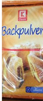
Backpulver im Tütchen [8]