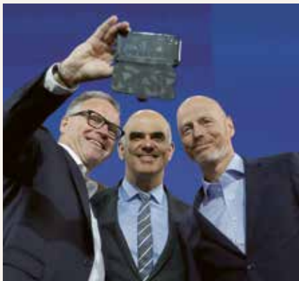
Spaltung der Gesellschaft auf Basis falscher Angaben: Ringier-CEO Marc Walder (r.) mit Berset.

Sie begründen das heute damit, dass zu jenem Zeitpunkt das fehlende Puzzleteil aus den Zulassungsstudien nachgereicht worden sei: der Beweis einer reduzierten Übertragung durch die Impfung. Dabei beziehen sie sich auf einzelne Studien, die später entstanden. Nun wisse man, so die Sonntagszeitung : Zu über 90 Prozent verhindere die Impfung «eine Infektion und damit auch eine Weiterverbreitung des